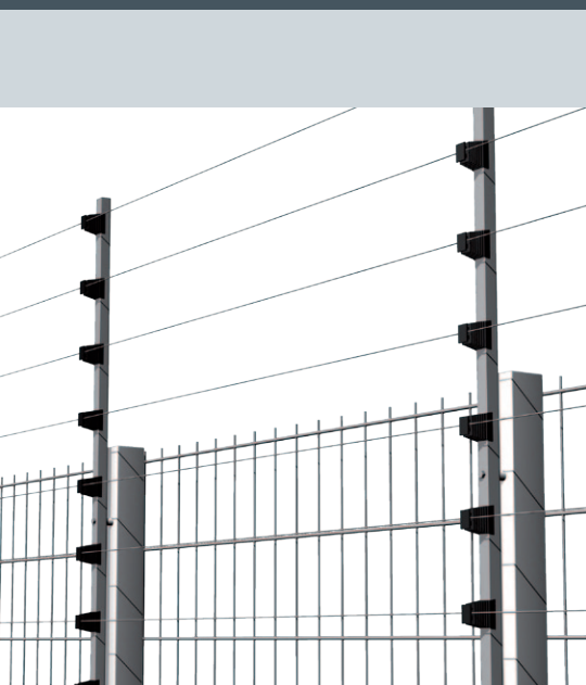
Befestigung der Isolatorenstange am Doppelstabgittermattenzaun. Effiziente Handhabung durch den patentierten STROMZAUN® Flex Isolator